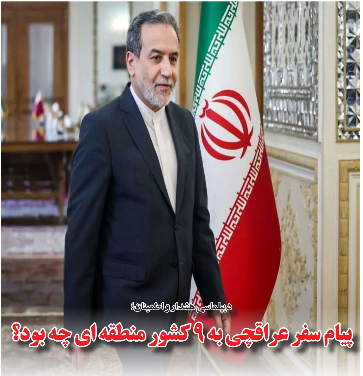
دیپلماسی هشدار و اطمینان؟

دوشنبه ۳۰ مهر ماه ۱۴۰۳ • سال یازدهم • شماره ۲۸۵ • ۱۲ صفحه • ۲۰۰۰ تومان • هفته نامه تخصصی، اقتصاد، صنعت و تجارت